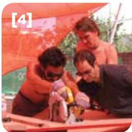
[1] presentación de un trabajo [2] Contacto Nacional realizando trabajos para la organización [3] artes visuales [4] trabajo [5] tutores preparando una de las presentaciones [6] preparación de planos en la fase inicial