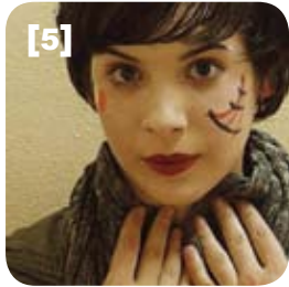
[1] paisajes de EASA008 [2] manifiesto redactado en EASA008 [3] ruta para la llegada a Letterfrack [4] feria de los talleres [5] Kata momentos antes de la realización de una performance [6] organizadores realizando un reportaje infográfico [7] presentación de los talleres [8] organizadores de EASA008 en una sesión de evaluación